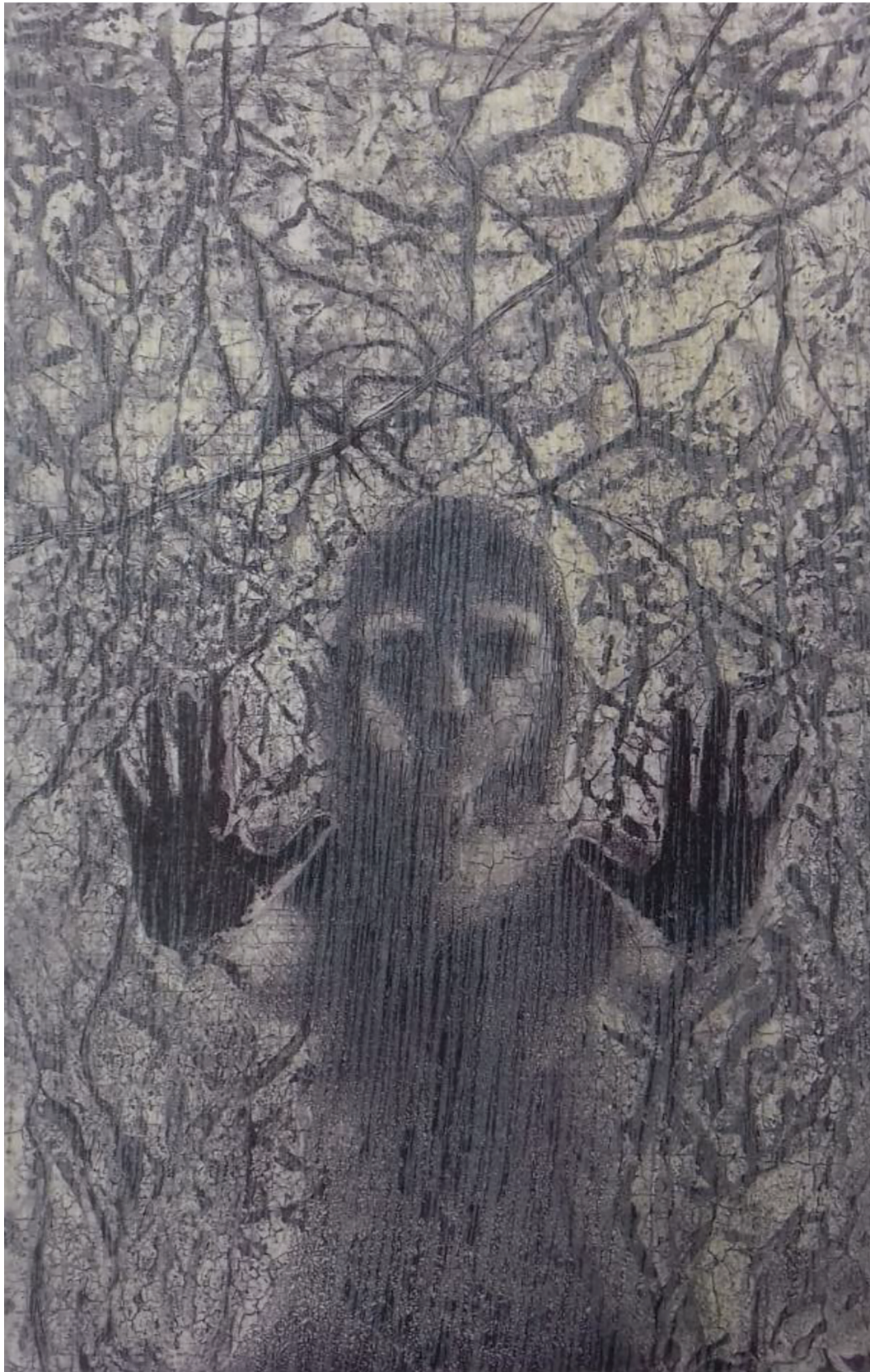
Nostalgia (2017). Aguafuerte, aguainta, ignoxilografía: Imelda Samano. Prohibida su reproducción en obras derivadas.